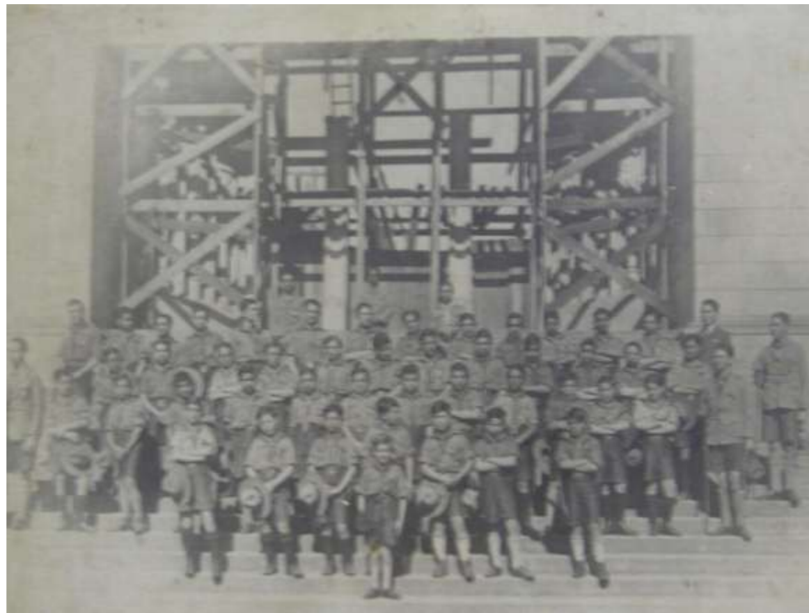
Grupo reunido em frente a Catedral da Sé ainda em construção - 1929