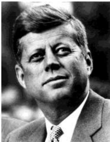
Presidente J.Kennedy EUA