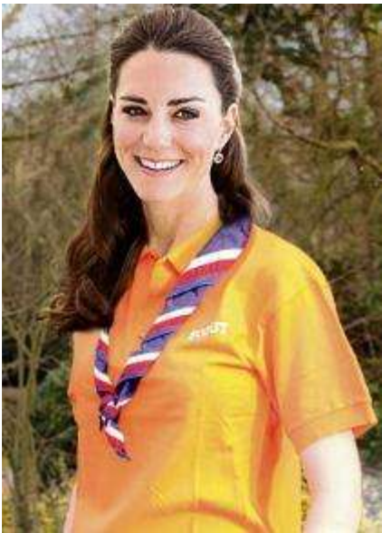
Princesa Kate Inglaterra