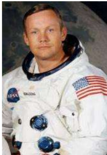
Astronauta Neil Armstrong EUA