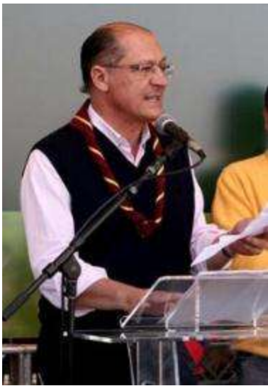
Governador Geraldo Alckmin