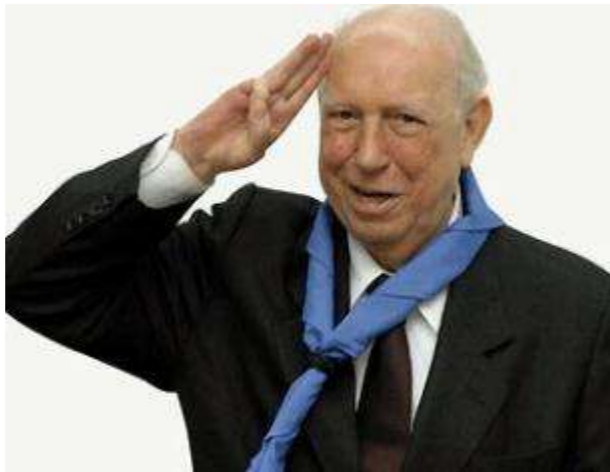
Vice Presidente José de Alencar