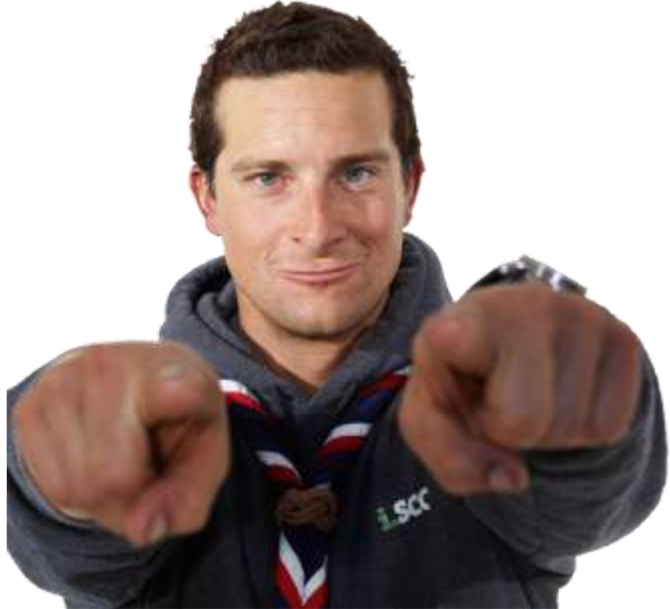
Bear Grylls – Aventureiro, apresentador de TV Inglês (A Prova de Tudo no Discovery Channel) e Chefe Escoteiro Mundial