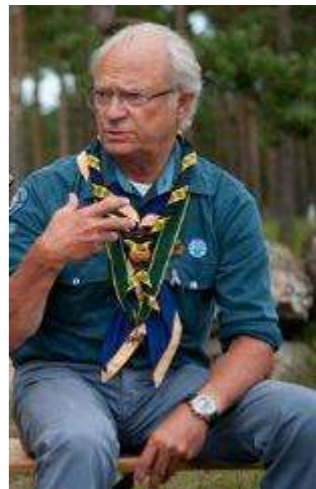
Rei Carl XVI Suécia