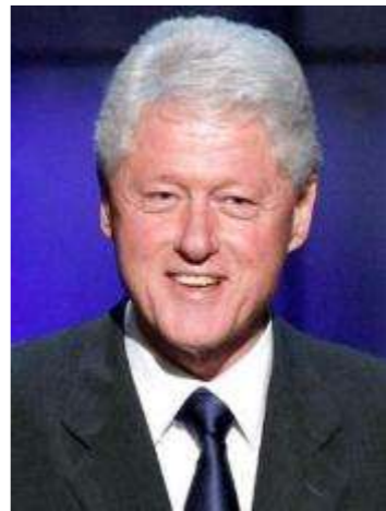
Presidente B.Clinton EUA